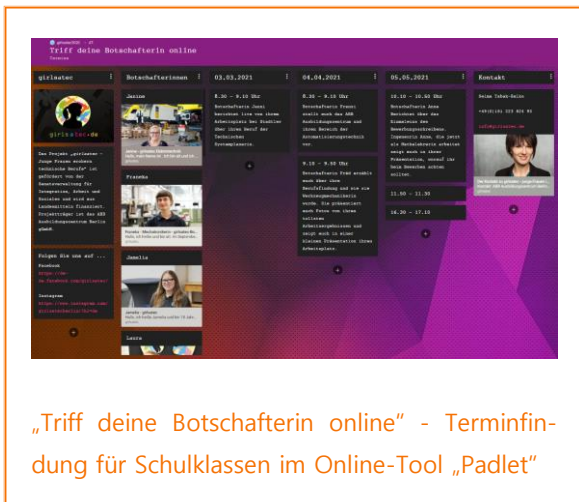
„Triff deine Botschafterin online“ - Terminfindung für Schulklassen im Online-Tool „Padlet“

Mehr Informationen über das neue Online-Angebot und zur Terminvereinbarung von Treffen mit unseren Botschafterinnen erhalten Sie hier .