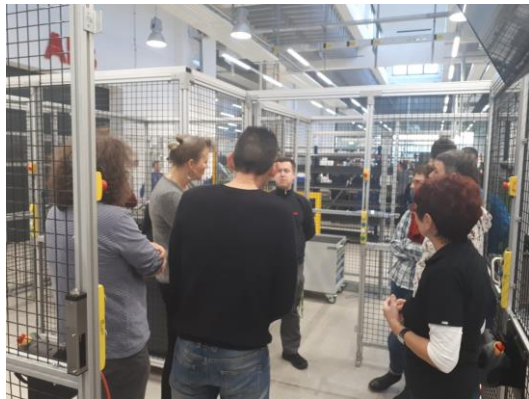
Interessierte Lehrer*innen bei der Lehrer*innen-Werkstatt im ABB Ausbildungszentrum