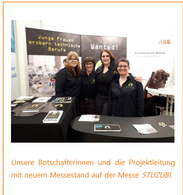
Unsere Botschafterinnen und die Projektleitung mit neuem Messestand auf der Messe STUZUBI .

Wenn Sie in Zukunft keine E-Mails mehr von girlsatec erhalten möchten, können Sie sich über folgenden Link mit einer formlosen E-Mail abmelden: Bitte zukünftig keine E-Mails mehr schicken.