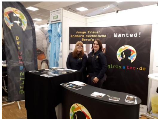
Unsere girlsatec -Botschafterinnen erreichten auf der Messe Stuzubi 76 Schülerinnen