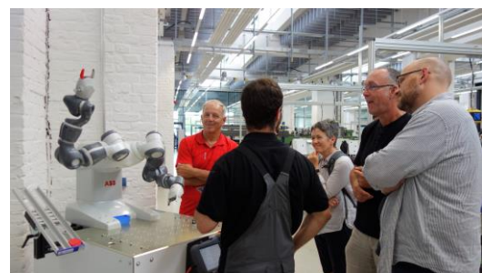
Roboter YuMi begrüßt die Pädagog*innen der Lehrer*innen-Werkstatt

Zu diesem Zweck bauten wir außerdem im vergangenen Quartal engen Kontakt zum BSO-Projekt und zu den WAT (Wirtschaft-Arbeit-Technik) Konferenzen auf. Von diesen Kontakten soll auch unsere gemeinsame Zusammenarbeit profitieren. Wir freuen uns auf ein neues Quartal und großartige neue Veranstaltungen!