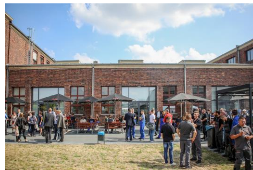
„girlsatec macht Schule“ und startet in das neue Ausbildungsjahr 2018/2019

Wenn Sie in Zukunft keine E-Mails mehr von girlsatec erhalten möchten, können Sie sich über folgenden Link mit einer formlosen E-Mail abmelden: Bitte zukünftig keine E-Mails mehr schicken.